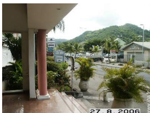
vue sur montagne