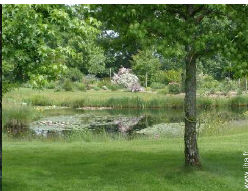
vue sur lac