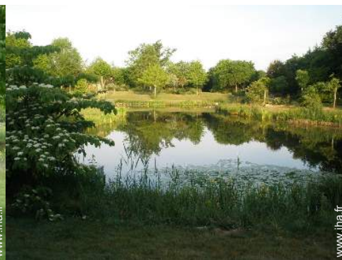
vue sur lac