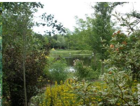
vue sur lac