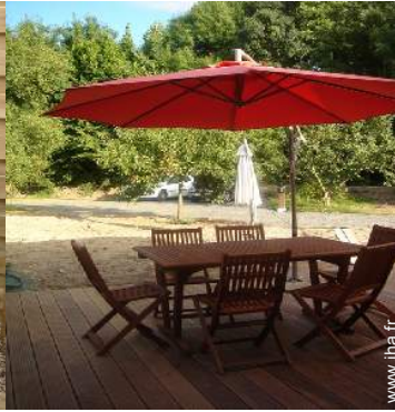
salon de jardin