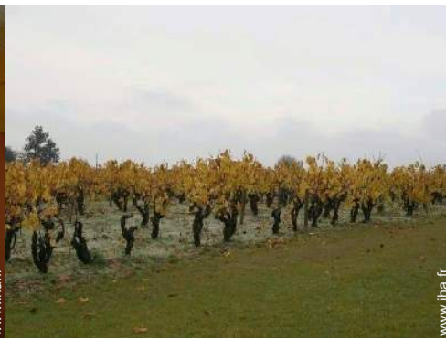
vue sur vignobles