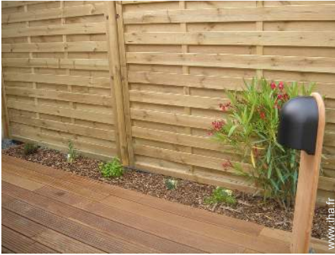
Installation extérieure à disposition des hôtes