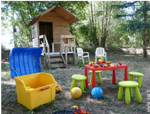
Equipements extérieurs à disposition des hôtes