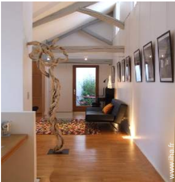
vue depuis le bureau