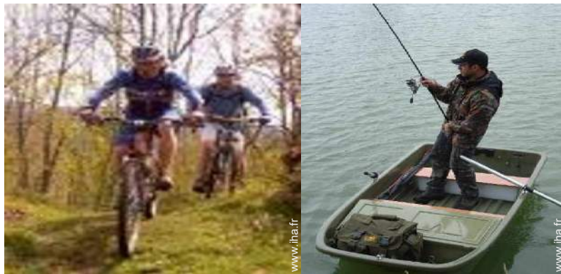
VTT (itinéraire circuit)