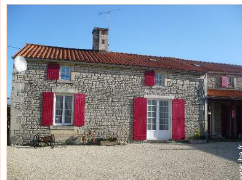
Ancien Corps de Ferme de Charme