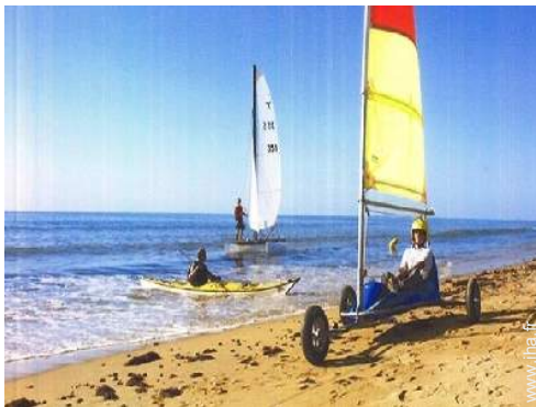
char à voile