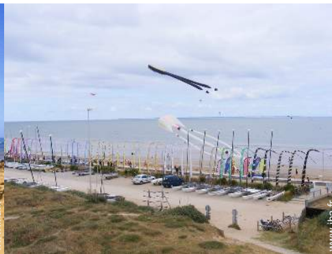
école de voile