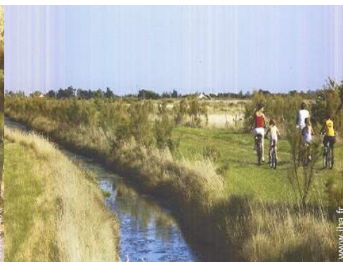
VTT (itinéraire circuit)