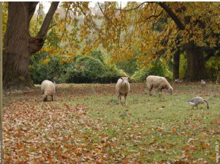
Les animaux de la maison