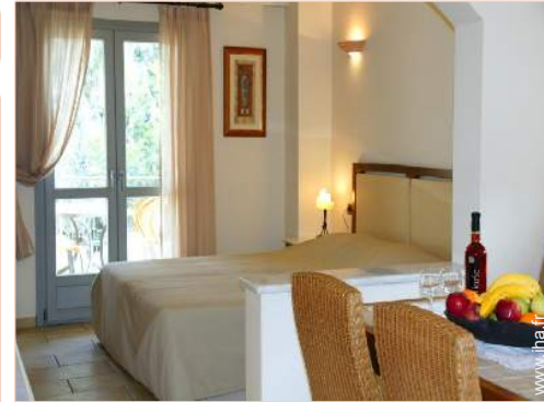
Maisonnette de Charme