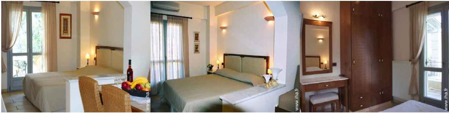
Maisonnette de Charme