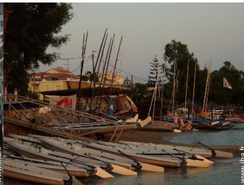
aménagement de loisirs