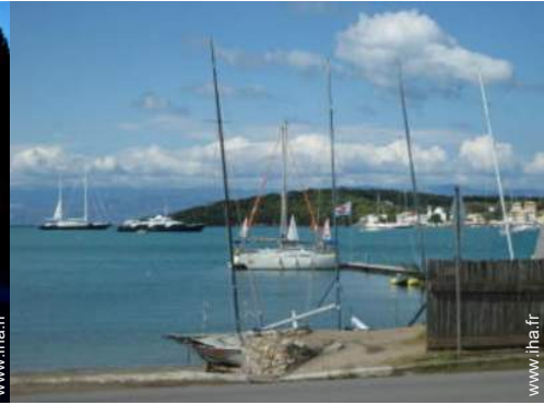
aménagement de loisirs