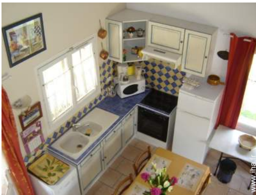
vue depuis la mezzanine