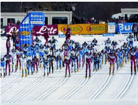
loisirs d'hiver à proximité