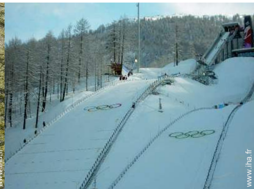
loisirs d'hiver à proximité