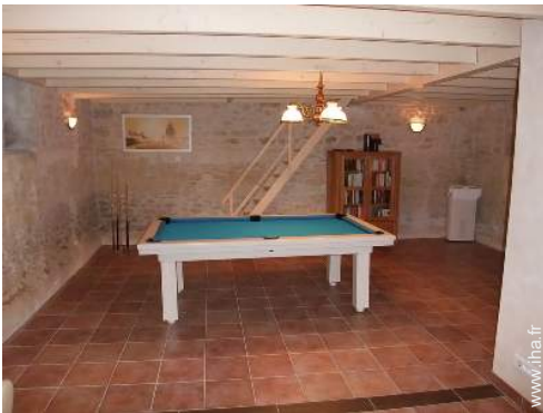
table de billard