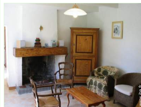
salon de musique