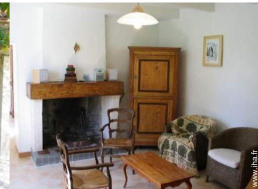
salon de musique