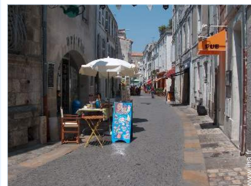
vue sur rue piétonne