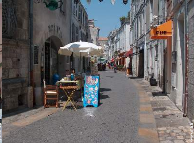
vue sur rue piétonne