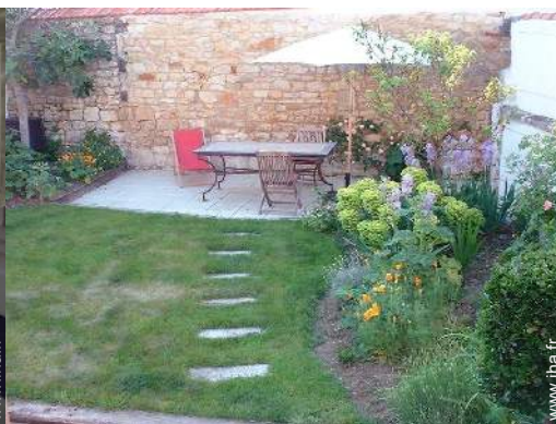
vue depuis la véranda