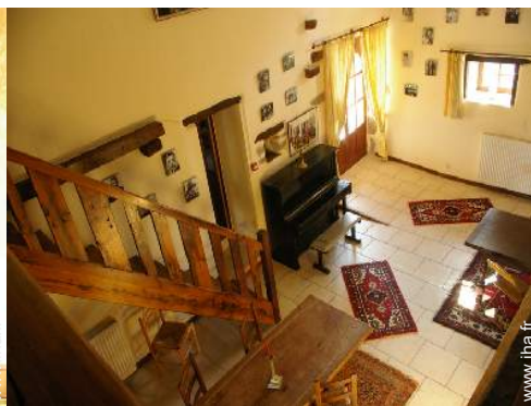
vue depuis la loggia