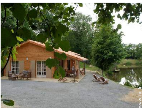
Maison de Charme en Bois