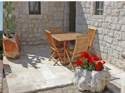
chaise(s) de jardin