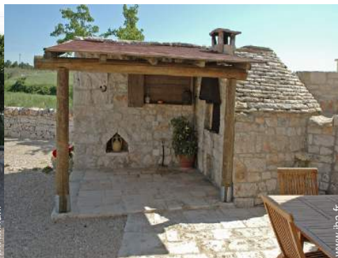
four à pizza