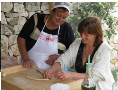
préparation repas local