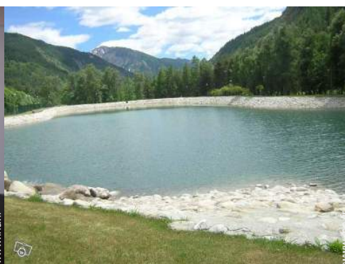
loisirs d'été à proximité