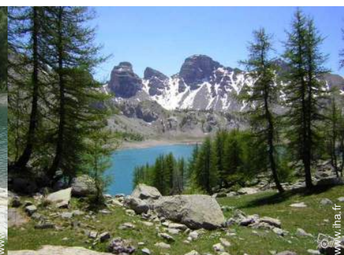
loisirs d'été à proximité