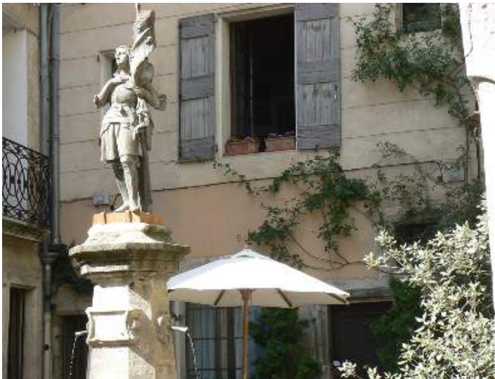
Maison de Charme en Pierre