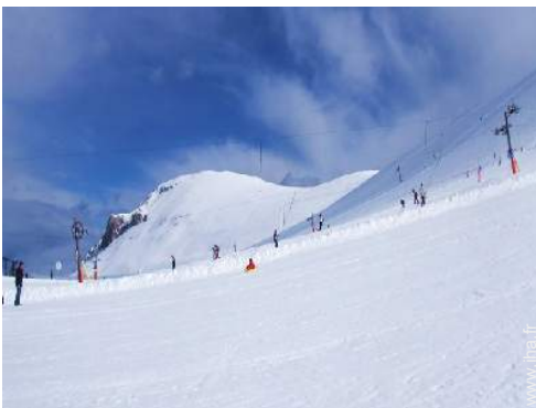
pistes de ski