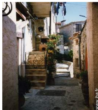
vue sur centre village