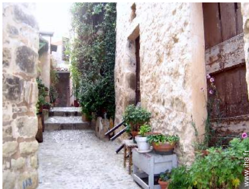
vue sur centre village