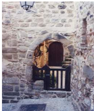
Maison de Village