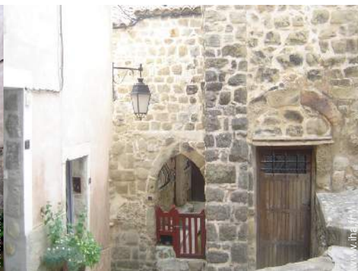
vue sur centre village