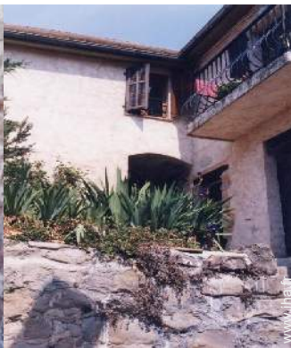
Maison de Village