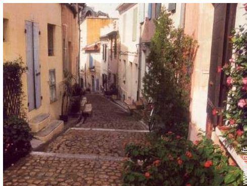
Maison de Ville