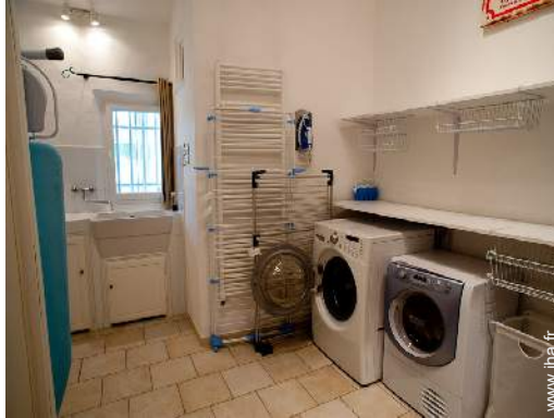
salle de jeux