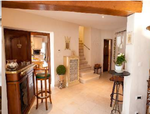
vue sur montagne