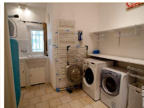
salle de jeux

Salon d'été, barbecue, barbecue à gaz, table (s) de jardin, 20 chaise(s) de jardin, tonnelle, parasol, salon de jardin, 15 chaise(s) longue (s), 15 transat(s), douche extérieure, WC extérieur