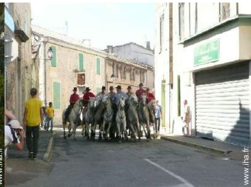
Attrails et détente