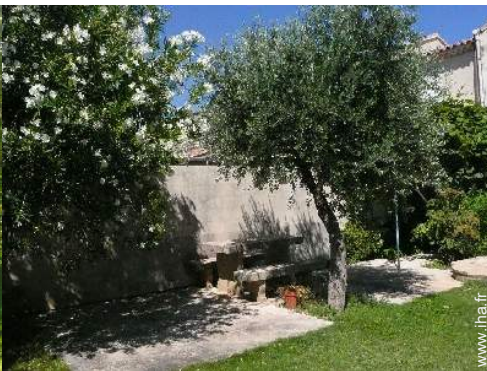
table(s) de jardin