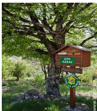
Chalet de Montagne de Charme