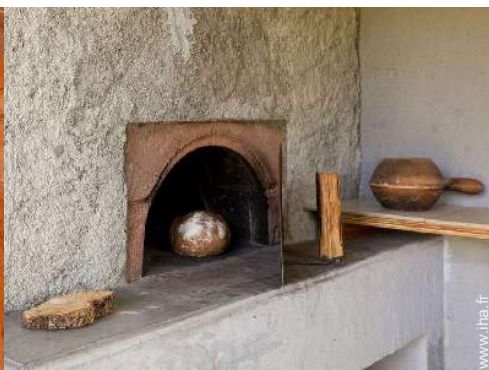
four à pizza