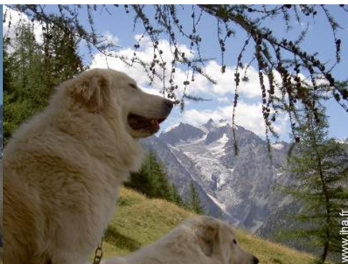
Les animaux de la maison