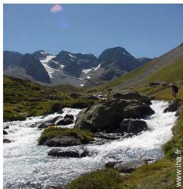
rapides sur rivières