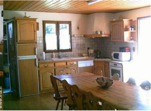
grande cuisine américaine