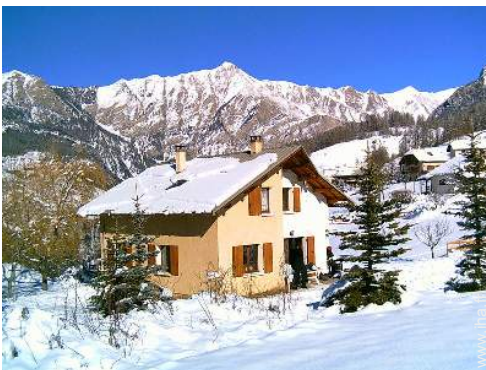
Chalet de Montagne