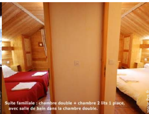
Suite familiale : chambre double + chambre 2 lits 1 place, avec salle de bain dans la chambre double.