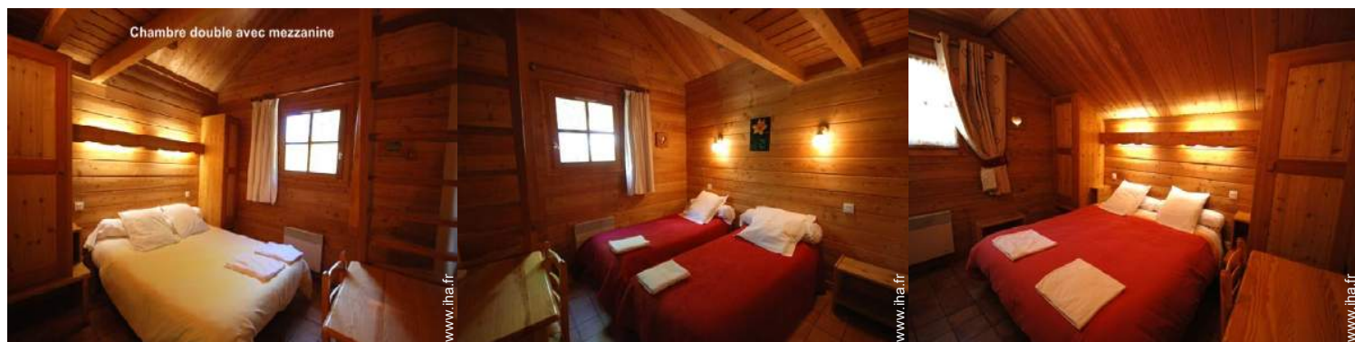
Chambre double avec mezzanine