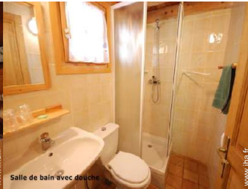
Salle de bain avec douche