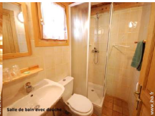
Salle de bain avec douche