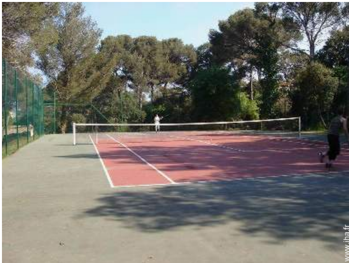
tennis dans la résidence