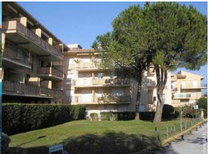
Résidence de standing