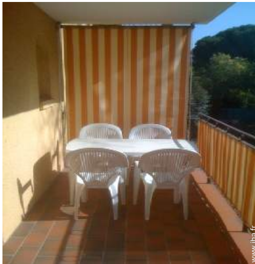
table(s) de jardin