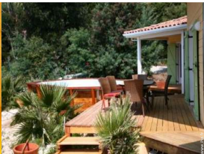
vue depuis la loggia