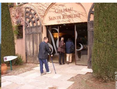
cave et dégustation de vin