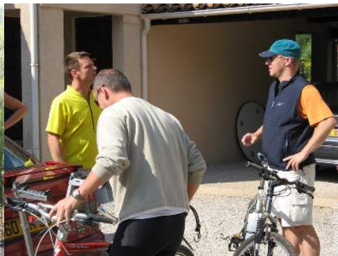
VTT (itinéraire circuit)