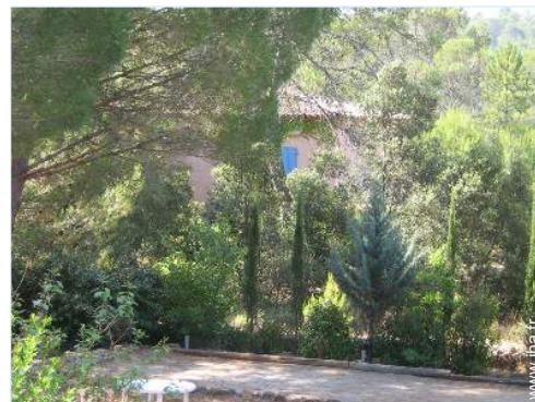
terrain de pétanque