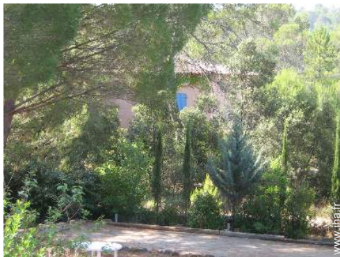
terrain de pétanque