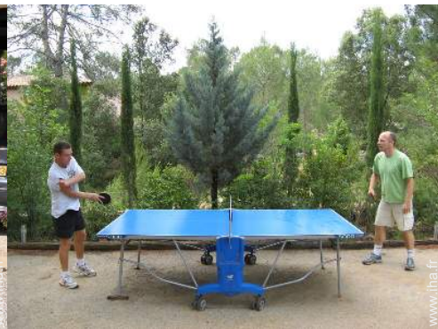
table de ping-pong