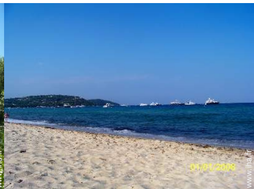
loisirs nautiques à proximité