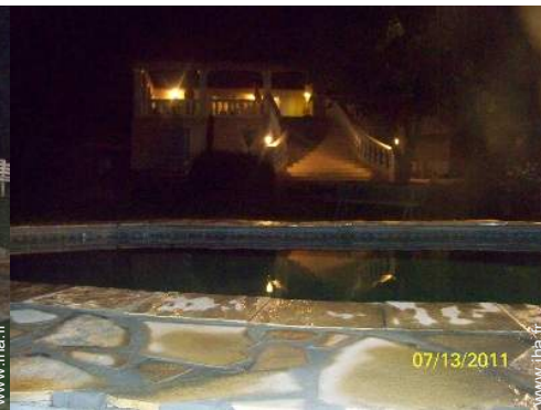
vue depuis la piscine