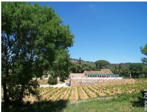
cave et dégustation de vin