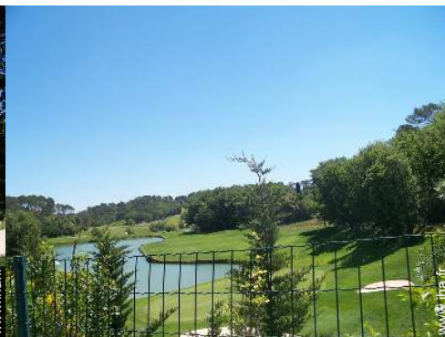
parcours de golf 18 trous