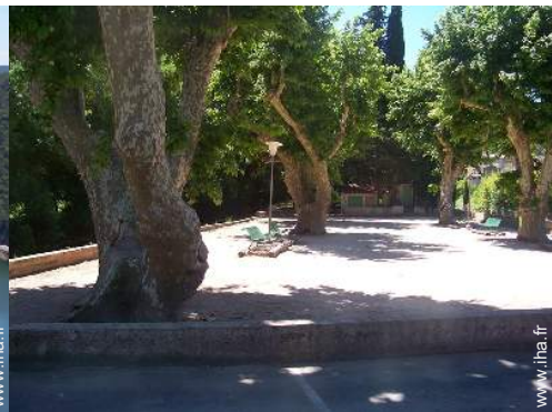
terrain de pétanque