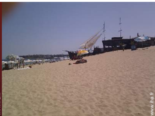
location de matériel de plongée