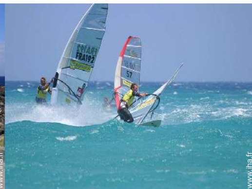
planche à voile