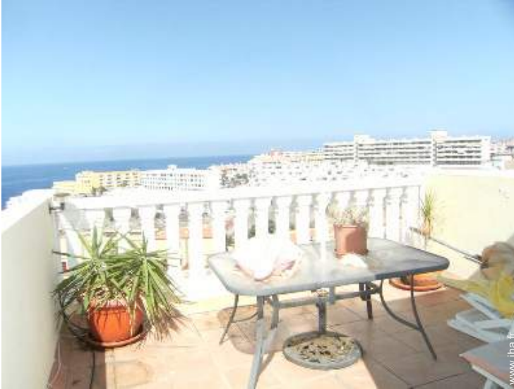
terrasse sur toit