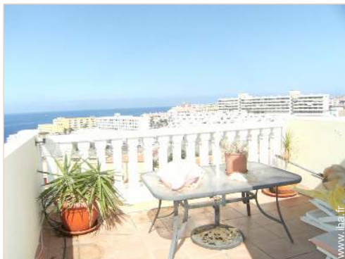
terrasse sur toit