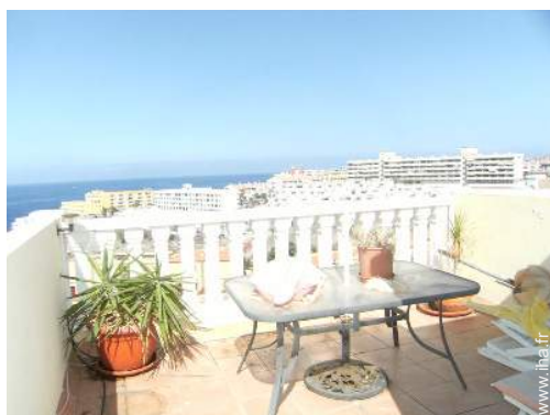
terrasse sur toit