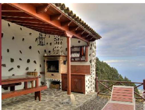
Equipements de loisir