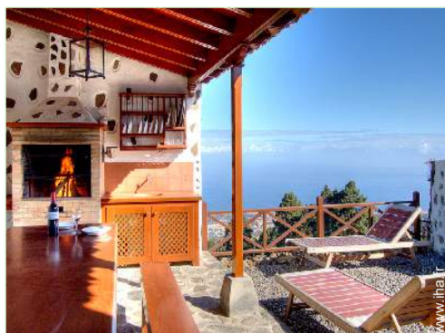
Installation extérieure à disposition des hôtes