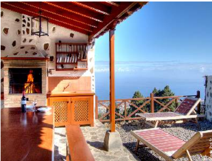
Installation extérieure à disposition des hôtes