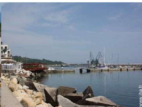
port de plaisance