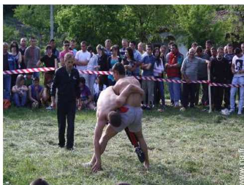
loisirs d'été à proximité