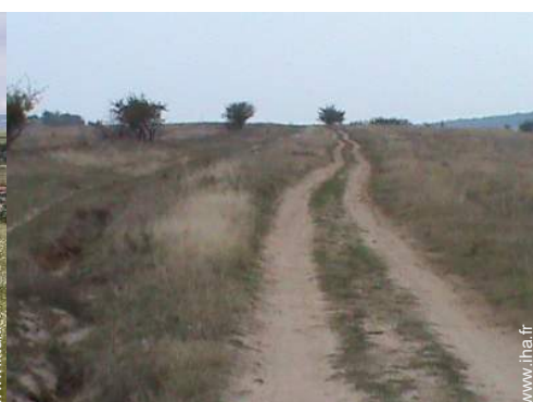
chemin de promenade