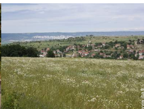
vue sur champs agricoles