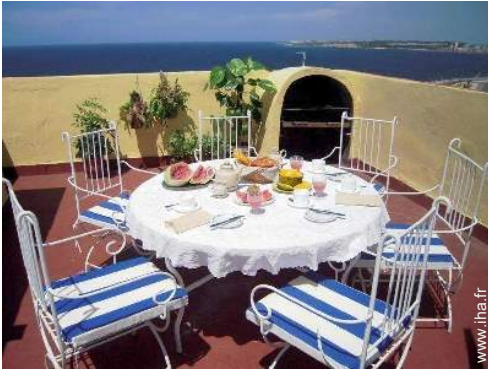
terrace sur toit