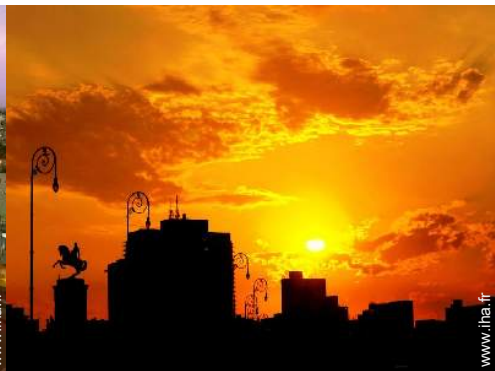
vue sur monument