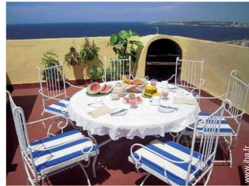
terrasse sur toit