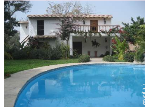
Bungalow de Prestige

Cheminée, T.V., vaisselle/couverts, magnétoscope, lecteur DVD, collection de films, téléphone, ordinateur, câble/satellite, accès internet, accès internet haut débit, sèche-cheveux, machine à glaçon/ice maker, moustiquaire aux fenêtres, ventilateur d'appoint, ventilateur mural, poêle à bois