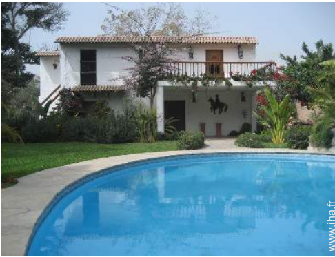
Bungalow de Prestige