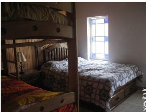
Bungalow de Prestige