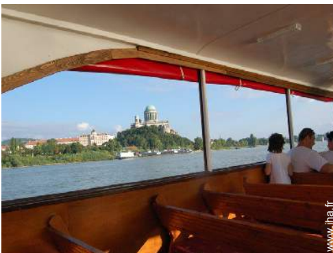
excursion en bateau