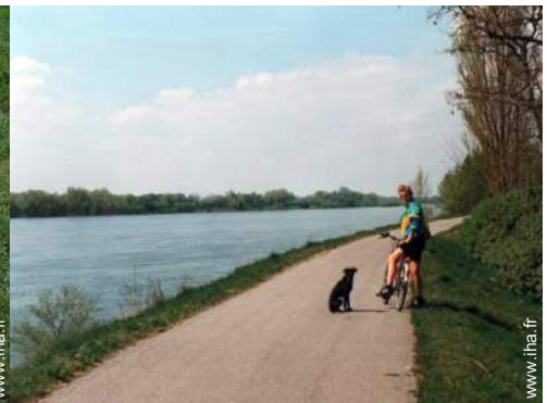
loisirs d'été à proximité