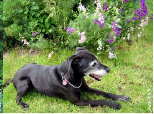
Les animaux de la maison