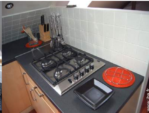
cuisinière à gaz