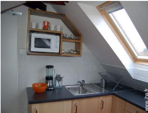
ustensiles et batterie de cuisine