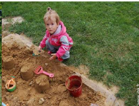
bac à sable