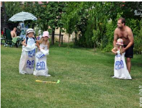
vue sur prairie