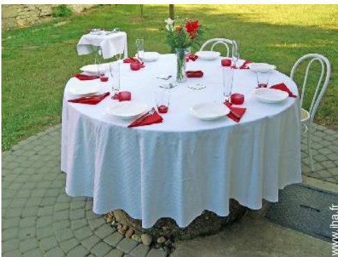
table(s) de jardin