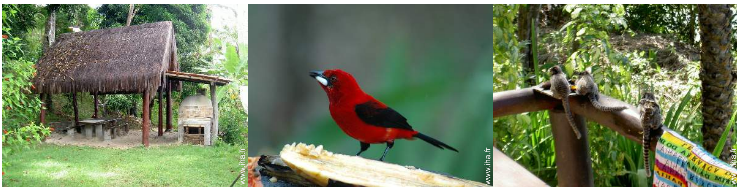
four à pizza