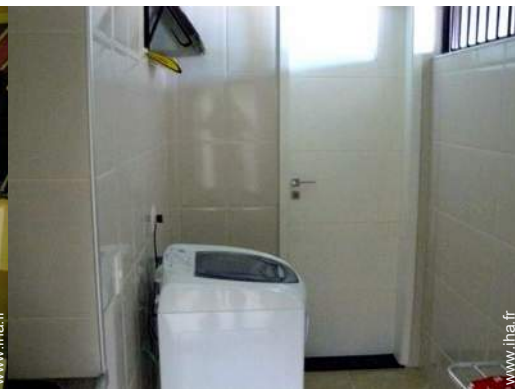
chambre de service