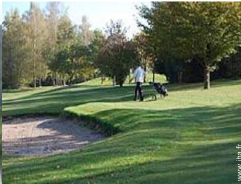
parcours de golf 18 trous