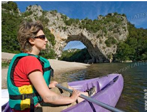
loisirs nautiques à proximité