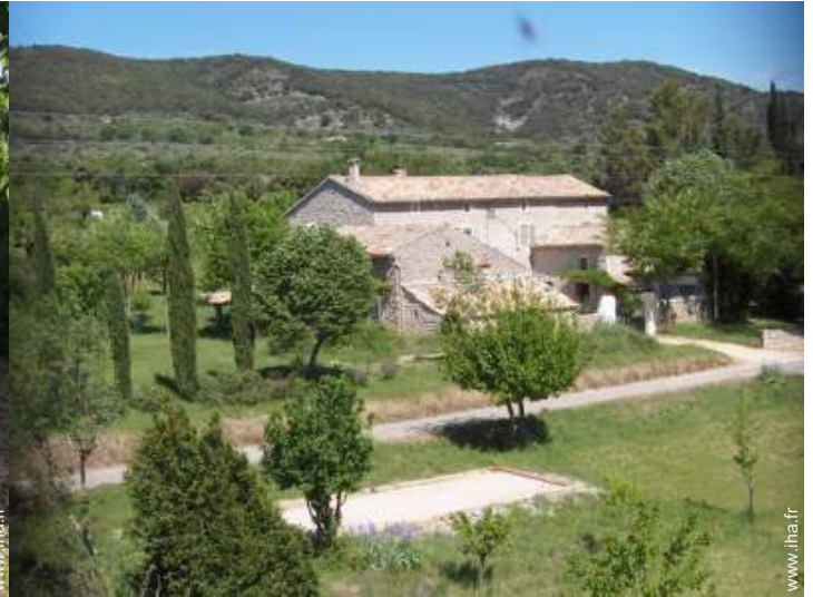
Mas de Charme