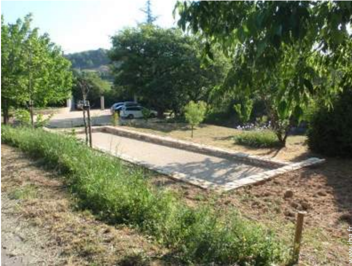
jeux de boules de pétanques