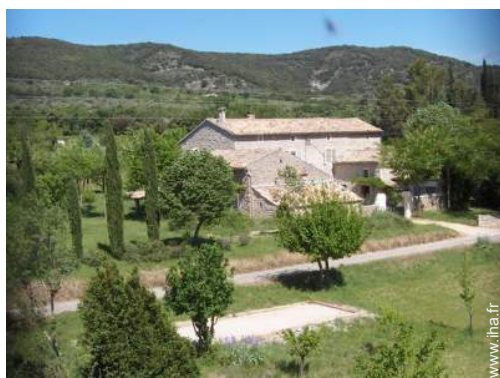
Mas de Charme