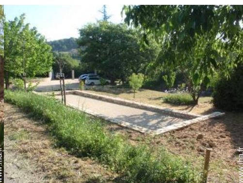
jeux de boules de pétanques