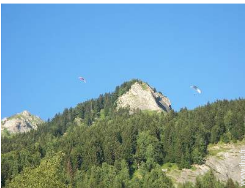
loisirs aériens à proximité