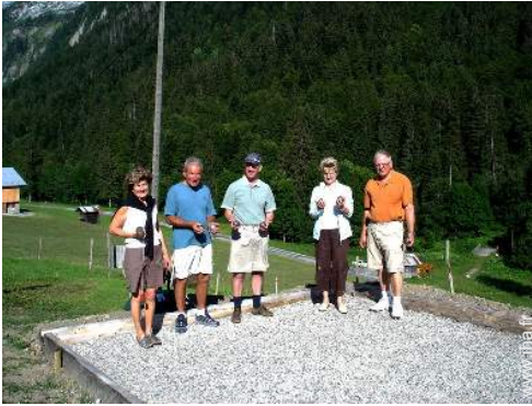
terrain de pétanque