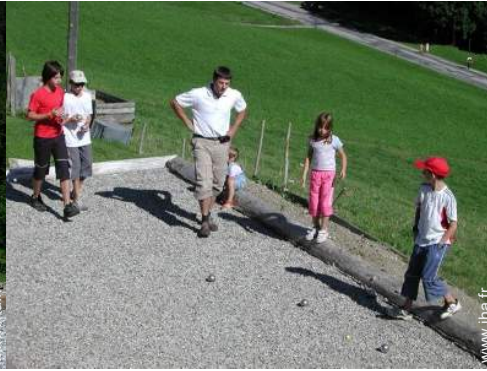
terrain de pétanque