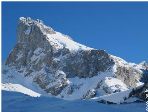
loisirs de montagne à proximité