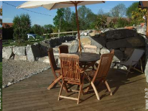
salon de jardin