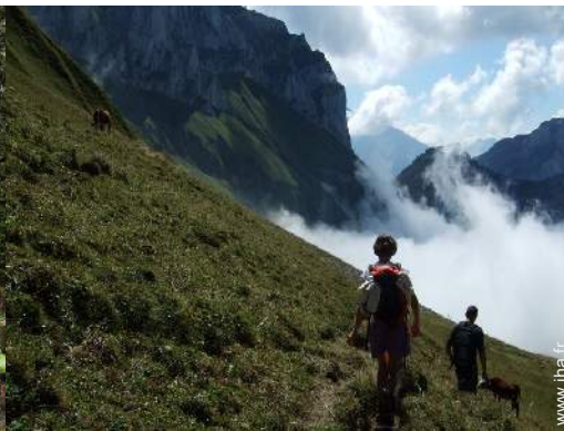
loisirs de montagne à proximité