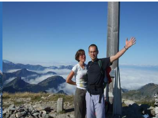
loisirs de montagne à proximité